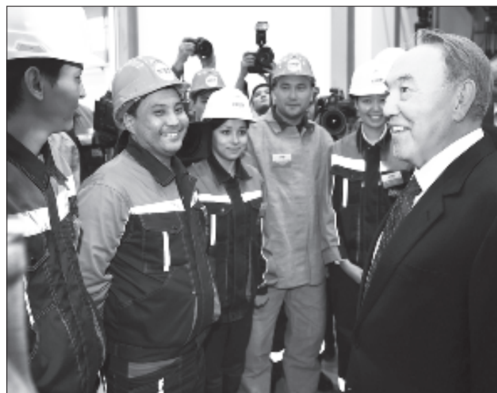
Президент Казахстана Нурсултан Назарбаев объявил Третью модернизацию республики