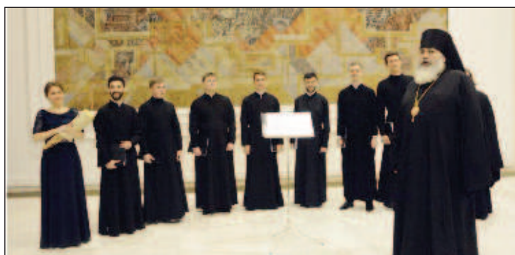
Камерный мужской хор г. Днепропетровска (Украина)