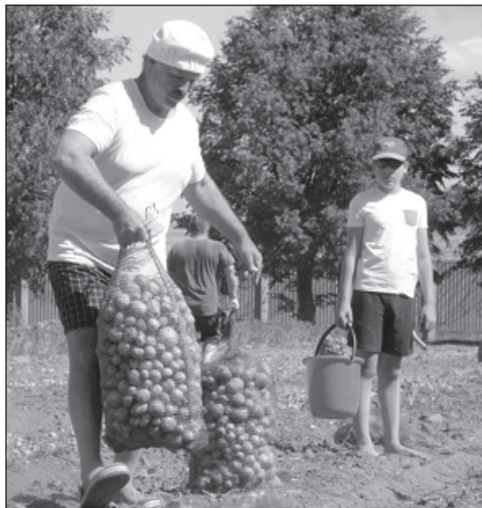
Александр Лукашенко и его сын Коля во время уборки урожая

Александр Лукашенко активно занимается сельским хозяйством в загородной резиденции. Он часто угощает гостей собственноручно выращенными овощами, например актера