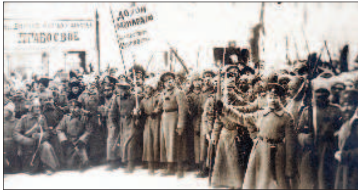
Первые дни Февральской революции