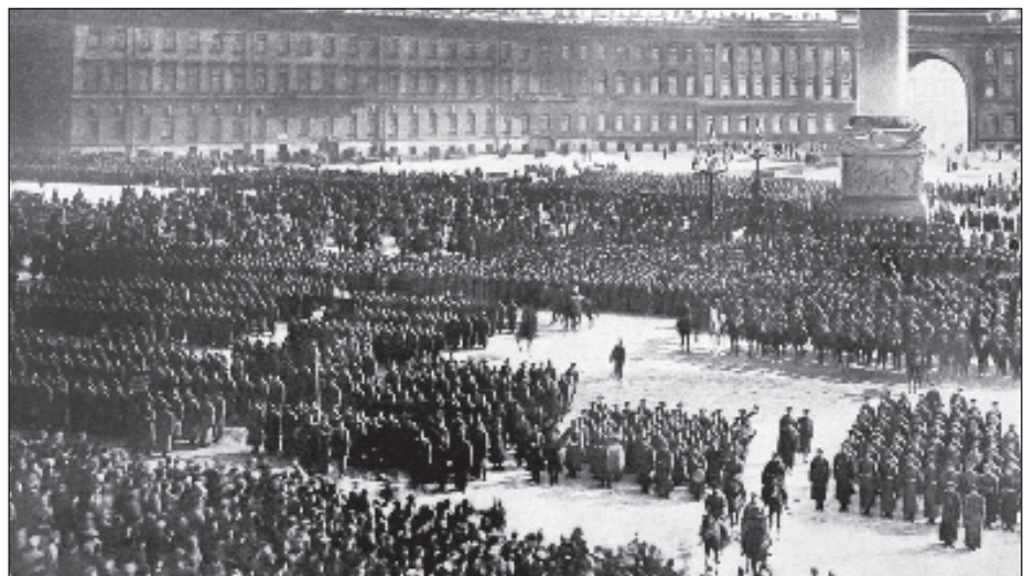
Офицеры и солдаты Петроградского гарнизона дают клятву верности революции

Сейчас нет смысла подробно останавливаться на том, почему "великокняжеская фронда" считала, что Николай II должен отречься, а Николай Николаевич - занять трон. Главное - это то, что царя предавало его ближайшее окружение - родственники. И, конечно, это играло на руку другим группам заговорщиков и облегчало их задачу по захвату власти. А детонатором для открытого выступления стали трудности со снабжением хлебом Петрограда и слухи о введении карточек на хлеб. Послышались вопли среди думцев, представителей "прогрессивной" обществен-