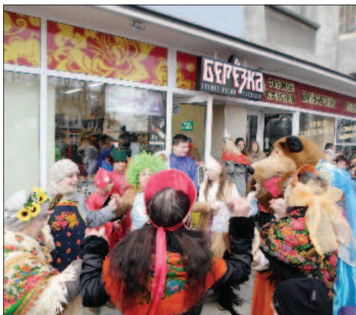
Скоморохи ученики 6д класса, которые изучают русский с первого класса вместе со своей первой учительницей