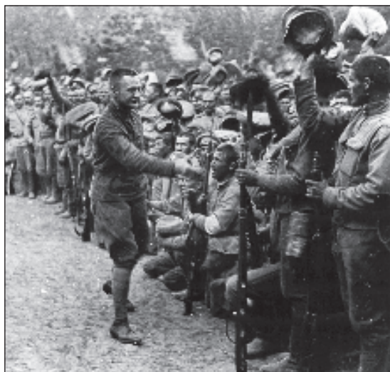
Александр Керенский: несостоявшийся вождь

ми миллионов капитала. И главное - с идеями и политическими амбициями: "Февральская революция - это кризис верхов. Это самое его яркое проявление. Много есть специалистов, которые исследуют экономическую обстановку в царской России, динамику развития индустрии, сельского хозяйства. Она была позитивная и шла по восходящей. Тем более, у царского правительства существовал в начале XX века план модернизационного рывка, если говорить современным языком.