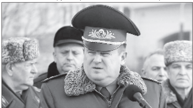
Министр обороны Белоруссии Андрей Равков

Стратегические учения "Запад-2017" пройдут в сентябре сразу на нескольких полигонах России и Белоруссии и станут главным мероприятием совместной подготовки вооруженных сил в этом году. По словам российского министра обороны Сергея Шойгу, при разработке сценария будет учитываться усиление активности НАТО вблизи границ Союзного государства.