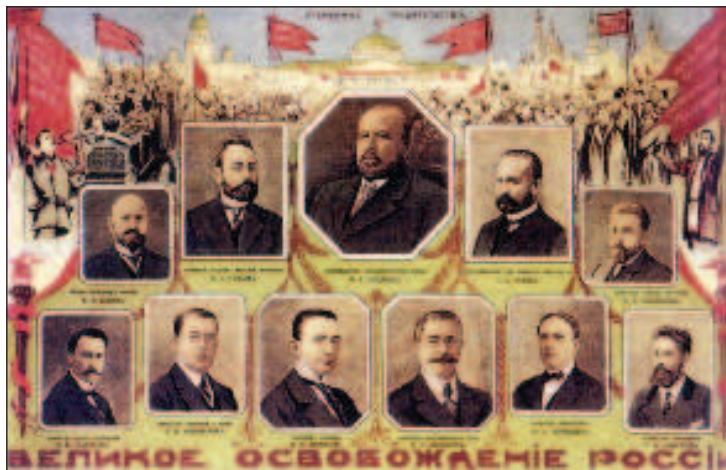
Агитационный плакат первого состава Временного правительства, выпущенный в марте 1917 г.